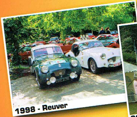
1998 - Reuver