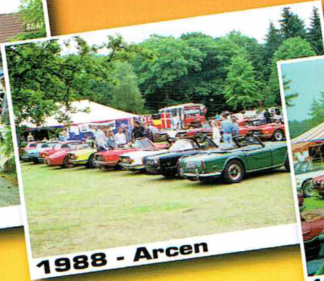
1988 - Arcen