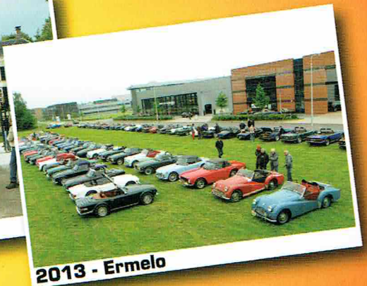
2013 - Ermelo