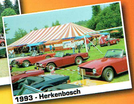
1993 - Herkenbosch