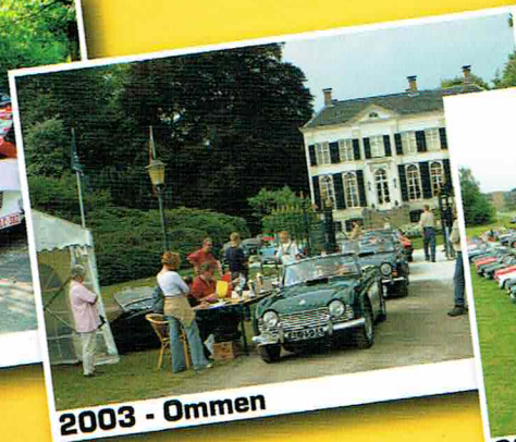
2003 - Ommen